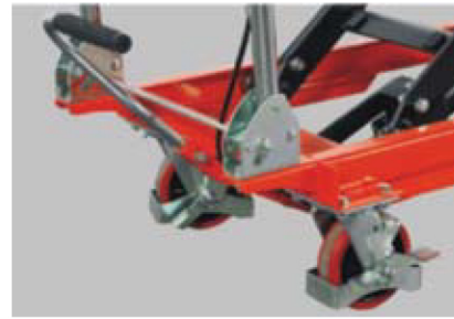
Foot pedal operated hydraulic lifting.

Lifting Lowering Transporting Always at the correct height